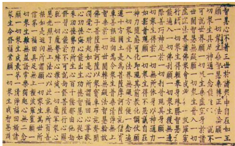
應縣木塔存《華嚴經》卷 26 之一 (圖 2)

無帙號。黑水城本《華嚴經》字體與木塔本不同，說明黑水城本是據傳入漢文本重新雕板的寺院刻本。