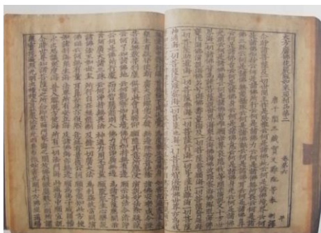
豐潤天宮寺塔《華嚴經》 8 （圖 1）

經濟繁榮，佛教興盛，不僅有房山雲居寺續雕石經，而且還在燕京設立印經院，雕印藏佛或寺院刻經，散施各寺院流通，有些經屬於民間社邑或寺院雕印。