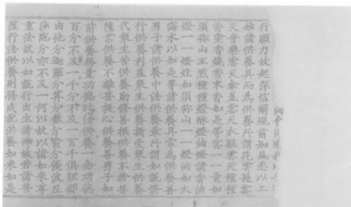
俄藏黑水城漢文 TK-88 (圖 3)