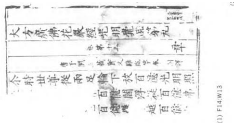
中國藏黑水城漢文《華嚴經》卷 13 殘葉（圖 4）

木塔本、韓國本行 15 字佛經皆有帙號，而上述黑水城本皆未有帙號，那傳入西夏底本是否有帙號呢？中國藏黑水城文獻有一件漢文 F14：W13《華嚴經》卷 13「光明覺品第九」（圖 4），實叉難陀譯，僅存一葉，刻本，蝴蝶裝？上下雙欄，右側單欄，無法判斷每紙的行數，整行 15 字，經題下有帙號「章」，經題前下面有雙行小字「大夏圓寂寺，賀家新施經」。這是西夏寺院新雕印單刻本，它與木塔第二種版本《華嚴經》帙號相同，字數相同，裝幀不同。可以說遼代有帙號的《華嚴經》也傳入西夏，F14：W13 延續遼藏經的特點，在裝幀上發生了變化。